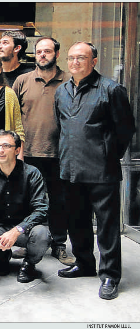
INSTITUT RAMON LLULL